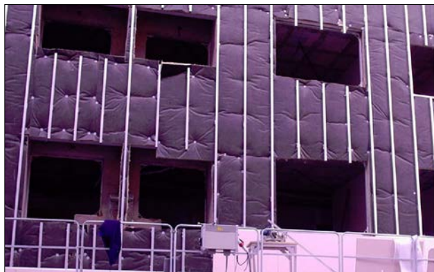
Fig.6: Fase de colocación de la subestructura de aluminio y del aislamiento en una fachada ventilada

En el diseño de la fachada es conveniente que se haya estudiado especialmente que las distancias horizontales entre ventanas, las distancias verticales entre dinteles de planta, las distancias con esquinas y rincones, las distancias con la altura de coronación de pretilas, etc., sean múltiplos exactos de las dimensiones de las piezas o baldosas (especialmente cuando el sistema es de piezas con junta abierta). Esta modulación permitirá no desperdiciar material, minimizar los procesos de corte en obra y evitar piezas o paneles en T o en L que pueden ser más propensos a fisurarse o desprenderse.