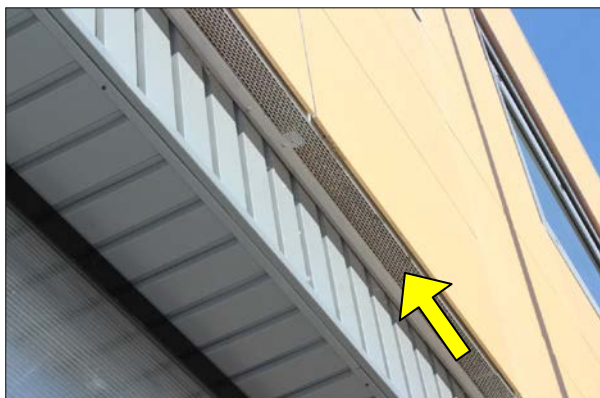
Fig.4: Vista de la rejilla inferior de ventilación de la cámara de aire de una fachada ventilada