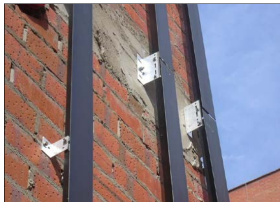
Fig.5: Colocación de los montantes y las escuadras de sustentación sobre la hoja principal de una fachada ventilada

A continuación, vamos a comentar ciertos aspectos de los materiales y piezas utilizadas para la capa de revestimiento exterior, en función de la utilización de algunos de los sistemas indicados en la Tabla 1.