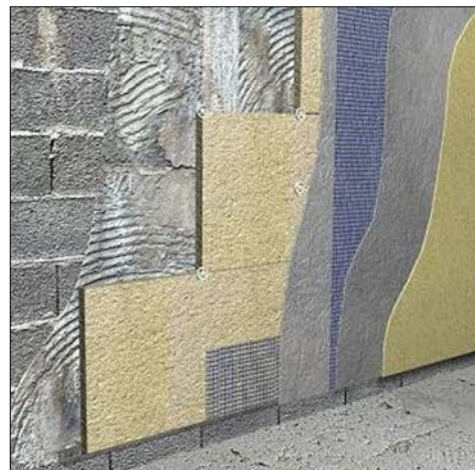
Fig.7: Infografía con la sucesión de capas a disponer en un sistema patentado de aislamiento térmico por el exterior

Como productos de aplicación superficial en húmedo, tendríamos: mortero de adherencia y uniformización (que debe poseer buenas características de adherencia y alto grado de deformabilidad; es la capa que se coloca entre el soporte y el aislamiento exterior), mortero de imprimación y regularización (capa situada sobre los paneles de aislamiento y previa a la aplicación del revestimiento, que contendrá la retícula de fibra de vidrio, y que mejora la absorción y la unión), y finalmente, morteros acrílicos para la realización del revestimiento exterior continuo (aplicados en capa fina para la impermeabilización, decoración y protección de la fachada).