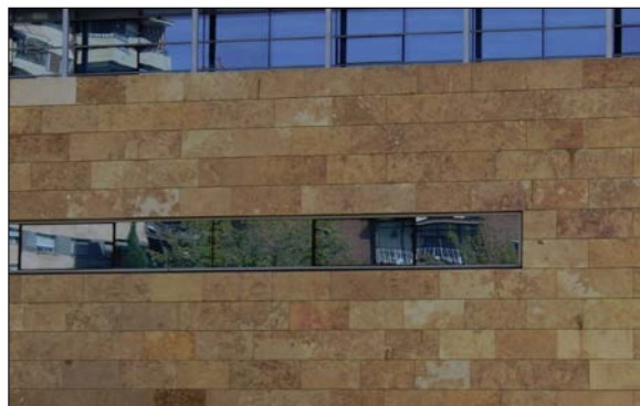
Fig. 2: Fachada ventilada con baldosas de piedra natural

Este Documento de Orientación Técnica es continuación del de 'Fachadas especiales: tipos y características generales (Fe-1)' y desarrolla dos tipologías que no fueron tratadas en el mismo. Las fachadas SATE (sistemas de aislamiento térmico por el exterior), la cual es un cerramiento con mucho futuro debido a las últimas modificaciones del CTE/DB-HE, así como las fachadas ventiladas , una tipología con más recorrido anterior. No hay que confundir este último tipo de fachada y denominación con la de las fachadas convencionales de ladrillo con cámara de aire interior aireada/ventilada; por tanto, las problemáticas y anomalías que pueden darse son diferentes puesto que el aislamiento está por delante, con una cámara de aire externa y un revestimiento con subestructura autoportante no estanco.