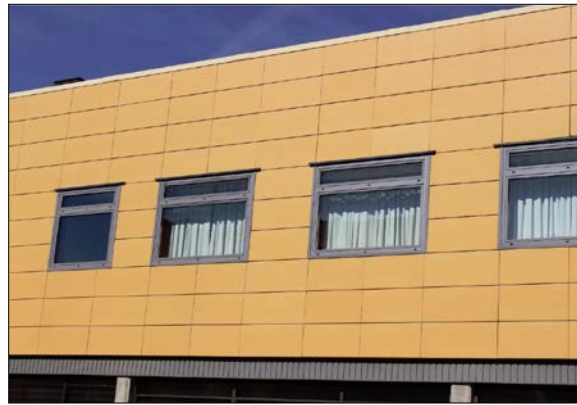
Fig. 1: Fachada ventilada con panel sintético rectangular

La propia fachada y sus zonas anexas habitables